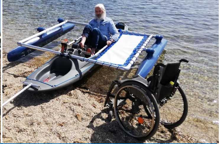
Neoprene socks screwed on the pedals