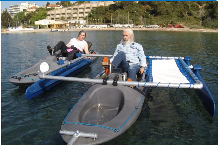
With an accompanying person